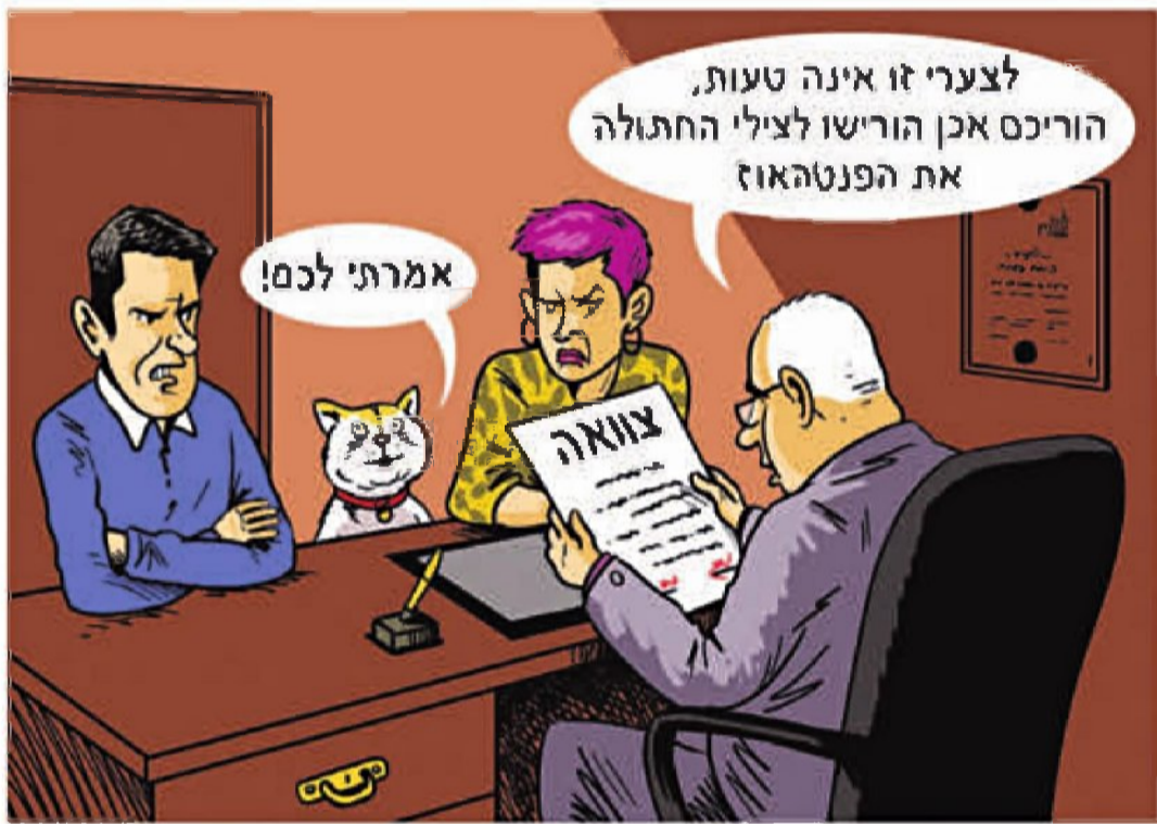
איור: גיא מורד

איך משפיעים גירושים על העסק המשפחתי, מתי כדאי לכתוב צוואה וכמה עולה לפרק את החבילה? אתם שאלתם, מומחי "ממון" לדיני משפחה משיבים